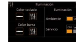
Contrôle des couleurs et de l'éclairage

Le nouveau panneau à écran tactile permet un contrôle absolu de la machine et offre une vaste sélection de fonctions utiles.