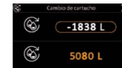
Notification de changement de cartouche d'adoucisseur d'eau