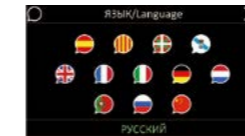
Sélection des langues