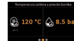
Surveillance de la température de la chaudière et de la pression de la pompe