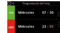
Programmation on et off