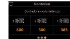
Surveillance des compteurs volumétriques