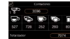
Compteur de dose de café